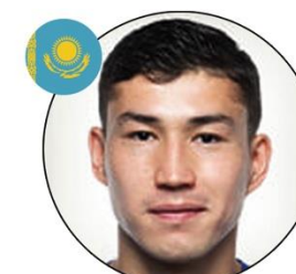
Bakhtiyar Zaynutdinov Fútbol Club CSKA