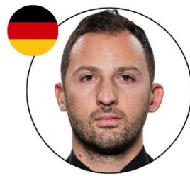
Domenico Tedesco Ex-entrenador de Club de Fútbol Spartak de Moscú