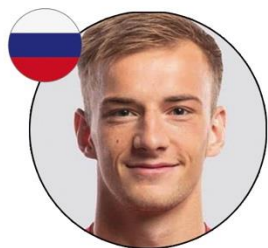
Konstantin Kuchayev Fútbol Club CSKA