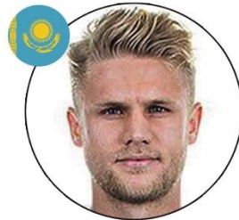
Alexander Merkel Fútbol Club Gaziantep