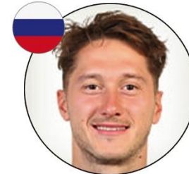
Anton Miranchuk Fútbol Club Lokomotiv